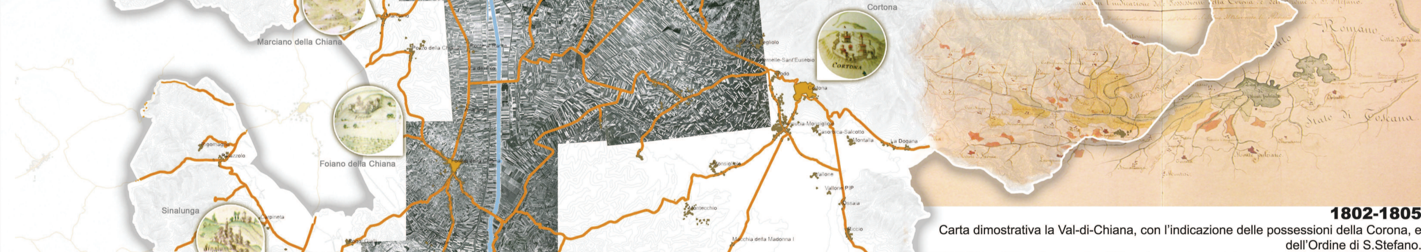
1802-1805 Carta dimostrativa la Val-di-Chiana, con l'indicazione delle possessioni della Corona, e dell'Ordine di S. Stefano.