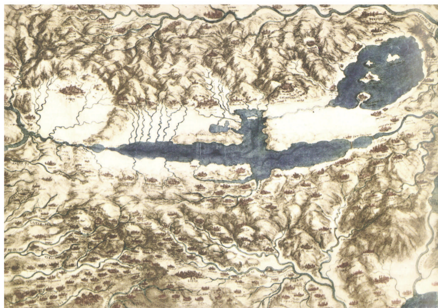
1502-3 Veduta a volo d'uccello della Val di Chiana di Leonardo