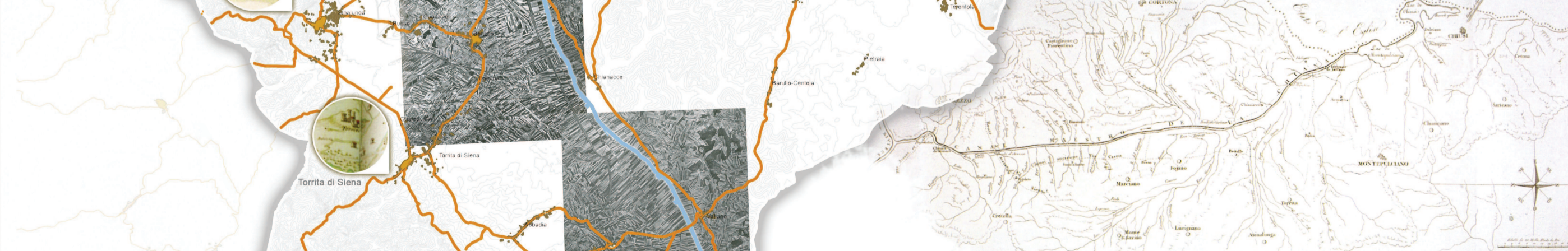
1819 Carte de la vallée e de la Chiana, située entre l'Arno et le Tibre