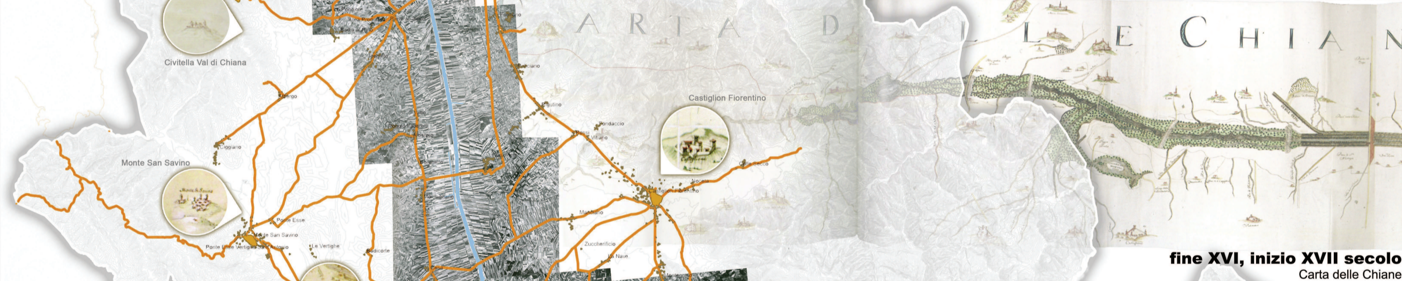
fine XVI, inizio XVII secolo Carta delle Chiane