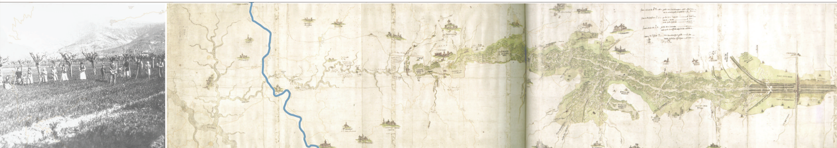
fine del 1500 Carta della Val di Chiana dal Tevere all'Arno

Elab. 04 TAV. 1.1 Data: 30.11.2017 Scala: 1:100,000