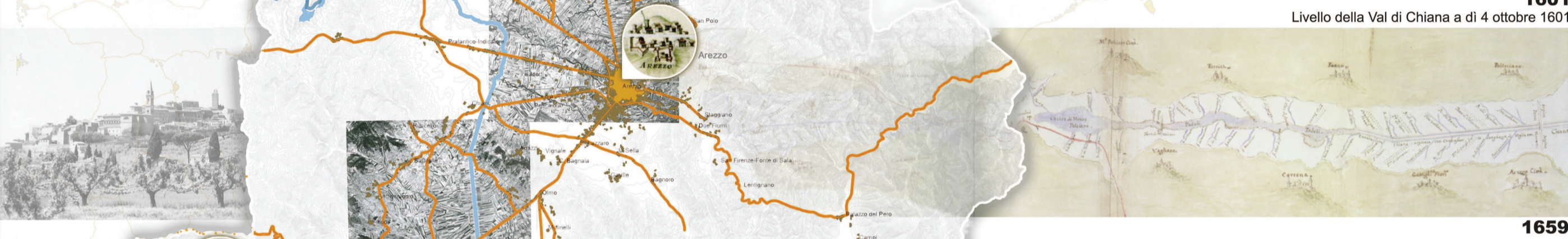
1659 Pianta delle Chiane dal Mur Grosso a Carnaiola sin'a Ponti Murati d'Arezzo