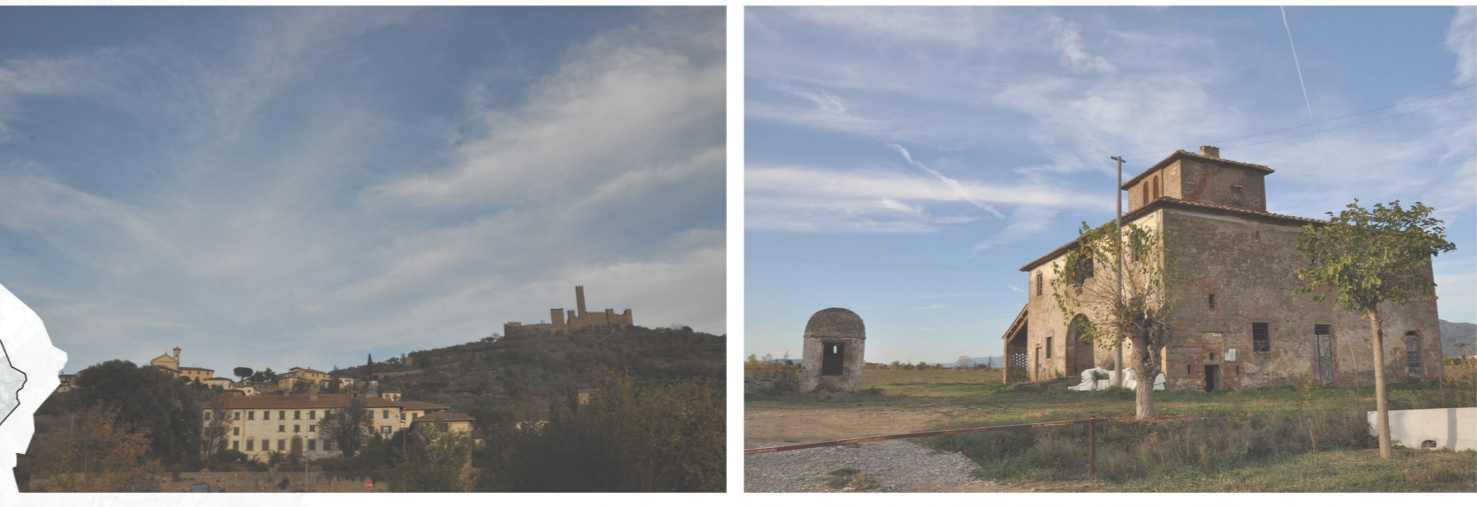
Fattoria Granducale di Montecchio Vesponi