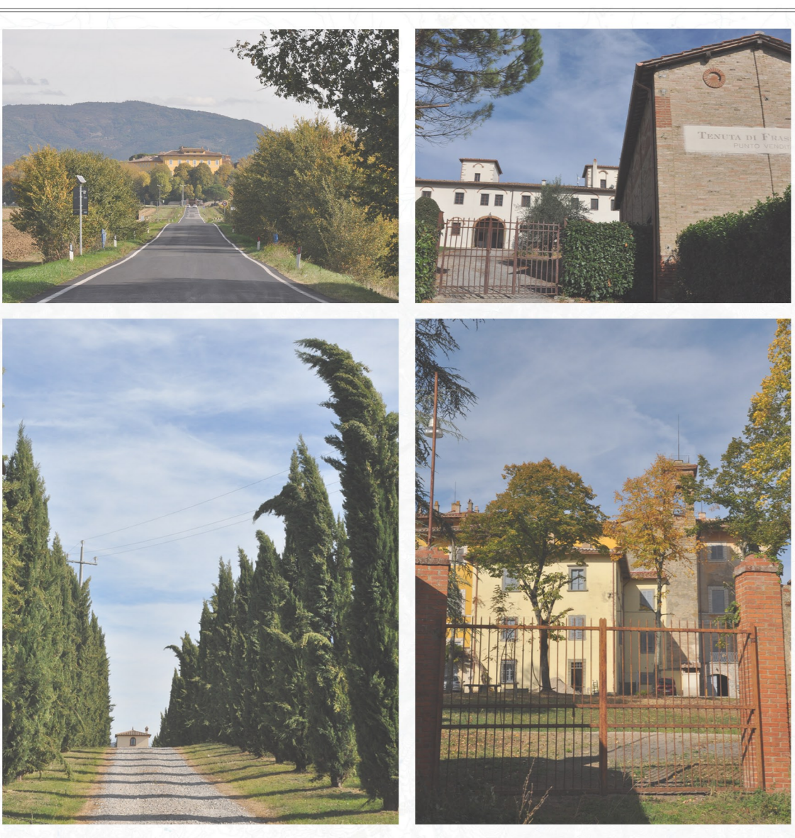
Fattoria Granducale di Frassineto