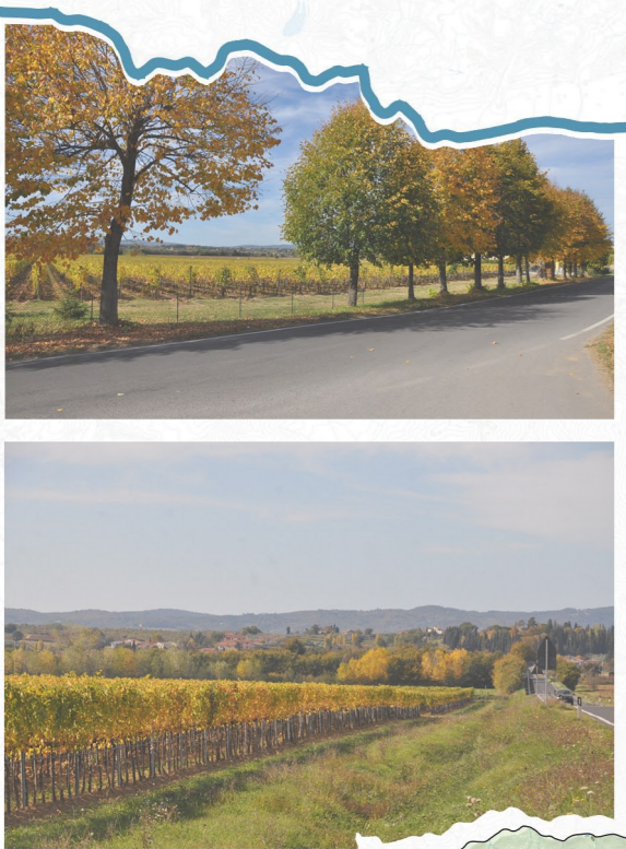
Colture specializzate nei pressi della Fattoria Granducale di Frassineto