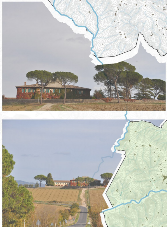
Fattoria Granducale di Brolio