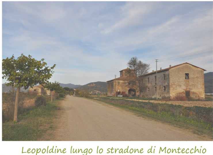
Leopoldine lungo lo stradone di Montecchio