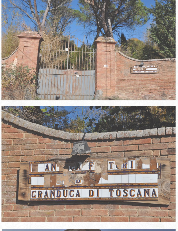
Fattoria Granducale di Acquaviva