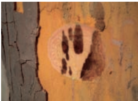
Presenza di macchie sottocorticali a "pelle di leopardo"

Sezionando il tronco o le branche si notano delle alterazioni cromatiche disposte in senso radiale.