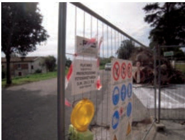
Prescrizioni fitosanitarie in presenza di platano infetto