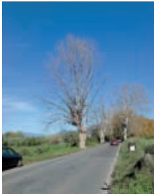
Fotografia a sinistra piante sane, fotografia a destra stesse piante morte in piedi a distanza di pochi mesi per il cancro colorato

Il fungo attacca tutte le piante appartenenti al genere Platanus , rappresentate nei nostri territori da P. occidentalis , P. orientalis e da Platanus x acerifolia , un ibrido fra le specie P. occidentalis e P.orientalis molto