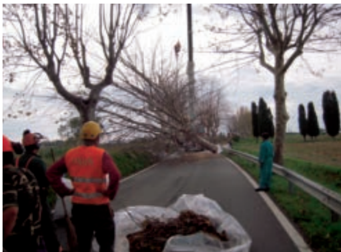
Operazioni di abbattimento eliminando la pianta con un solo taglio alla base